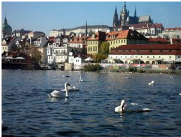
Prager Stadtansicht von der Moldau aus.