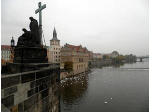
Blick von der Karlsbrücke in Prag.