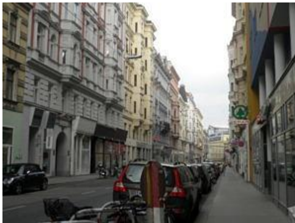
Blick aus dem Kolpinghaus in Wien.