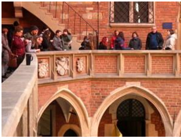
Innenhof der Krakauer Jagiellionen-Universität.