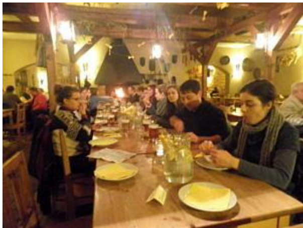
Gemeinsames Abendessen im Kloster Breunau.