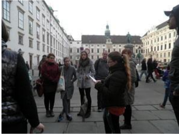
Referat in der Hofburg.