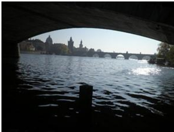
Ansicht der Karlsbrücke.