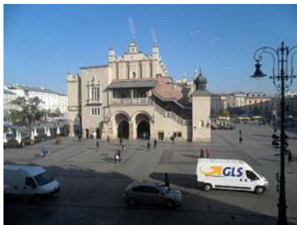
Blick auf die Krakauer Tuchhallen (Sukiennice) auf dem Marktplatz.