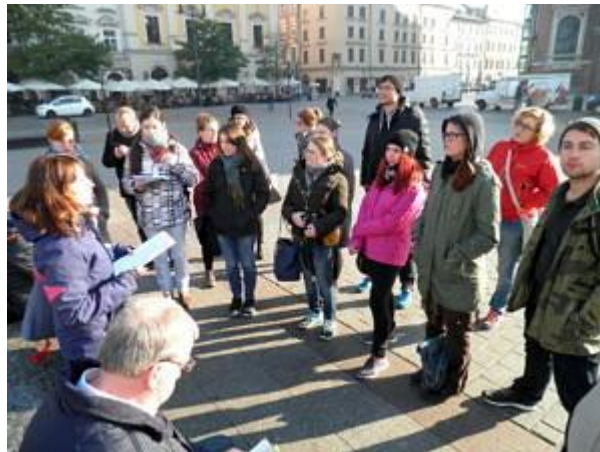
Referat auf dem Krakauer Hauptmarkt (Rynek Glowny).