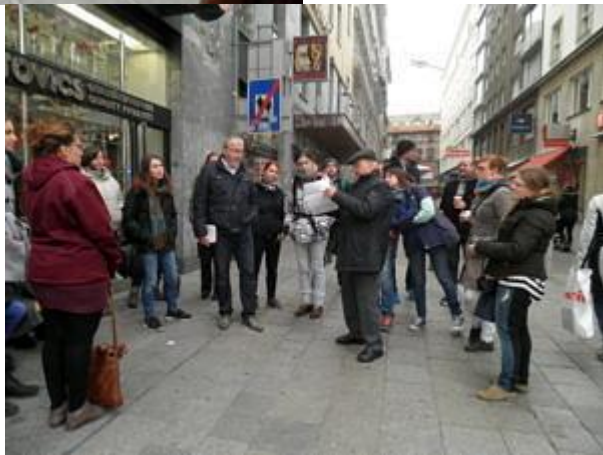
Referat auf dem Wiener Stephansplatz.