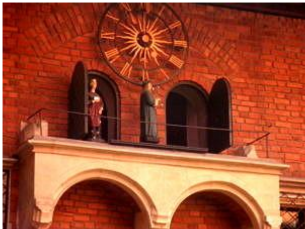
Mechanisches Uhrwerk mit einem Umzug von beweglichen Figuren der Jagiellionen-Universität.