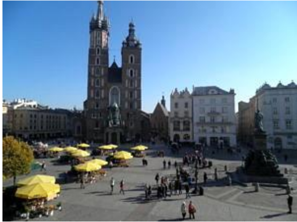
Blick von den Tuchhallen aus auf Marktplatz und Marienkirche (Kosciol Mariacki).