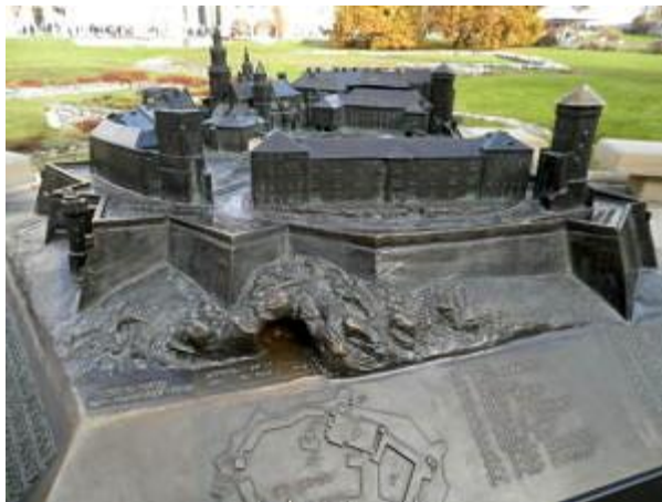
Miniatur des Wawel, mit Kathedrale, Schloß und anderen kirchlichen sowie weltlichen Bauten und Befestigung.