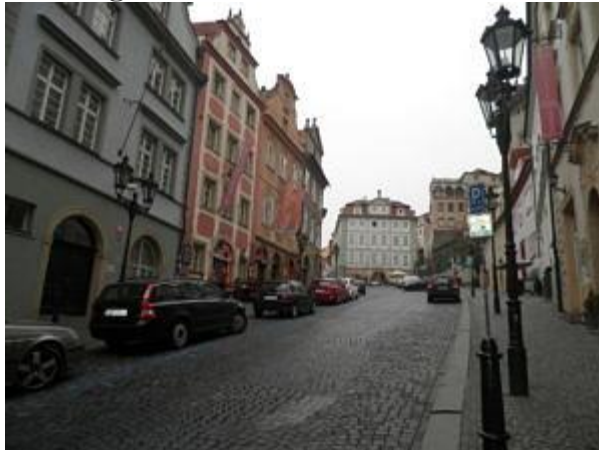
Blick aus dem Hostel Arpacay Backpacker auf u.a. das Schwarzenberg Palais.