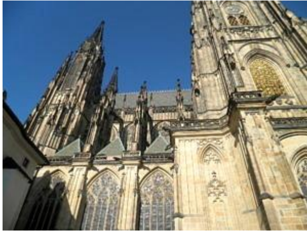
Detailansicht des Veitsdom in Prag.