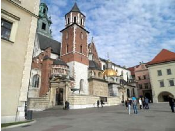
Blick auf die Kathedrale auf dem Burgberg (Wawel).