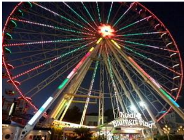
Riesenrad auf dem Wiener Prater.