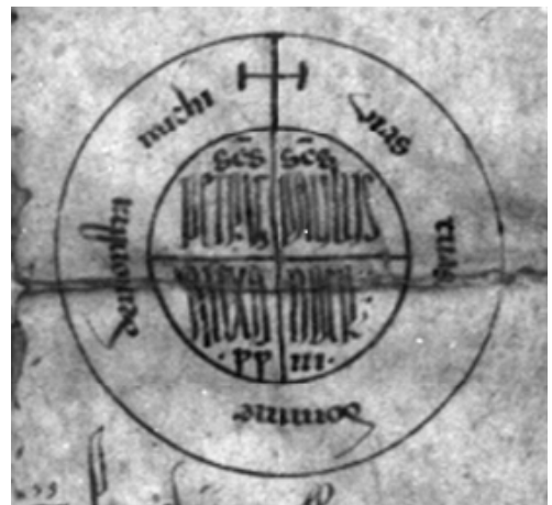
Rota auf einer Urkunde Papst Alexanders III. von 1175, Wikimedia Commons.